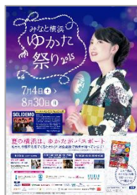
みなと横浜 ゆかた祭り 2015