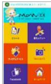
横浜に来る、楽しむ 味わう、回遊する 全てのお客様向け サービスポータル& アプリ開発