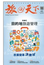
台湾人観光客 向け誘客 プロモーション 事業