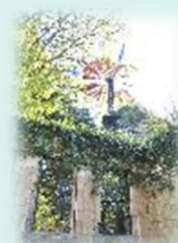
旧フランス領事官邸