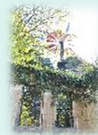
旧フランス領事官邸