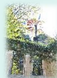
旧フランス領事官邸